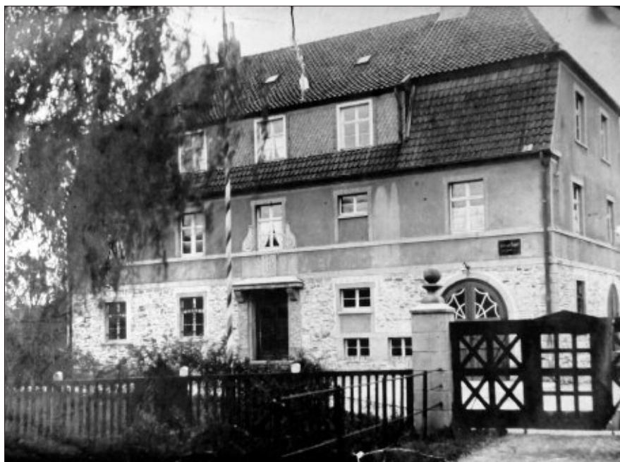
Das Haus Pippert Im Bruch anno 1920