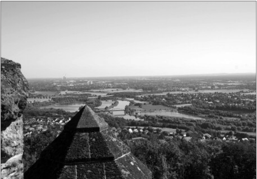
Nach Norden geht der Blick über die Stadt Minden weit in die Tiefebene