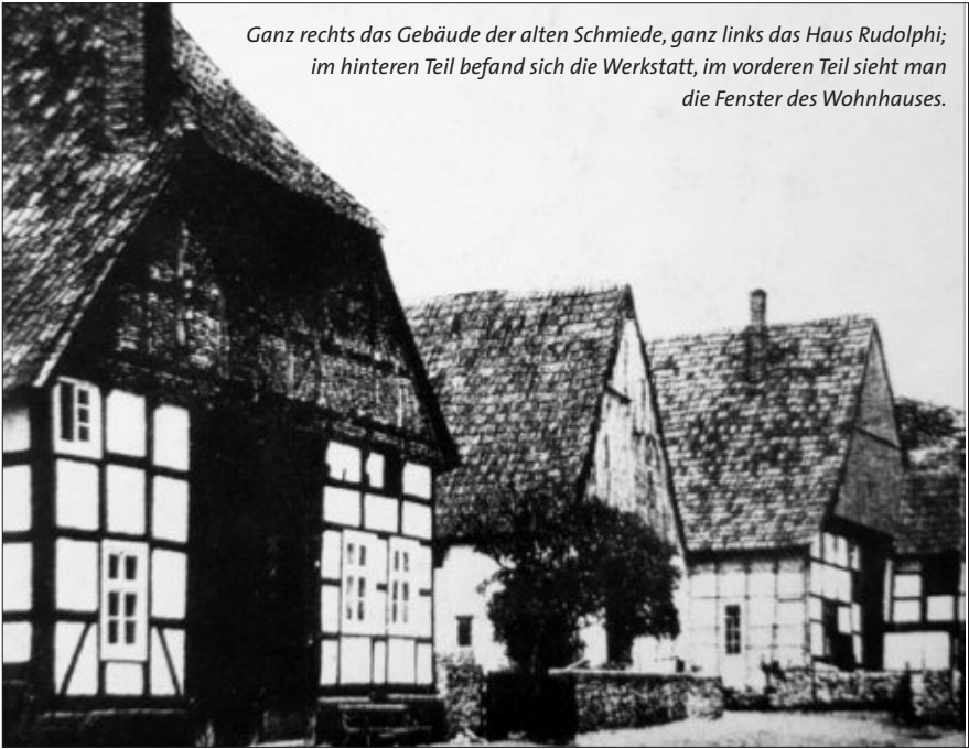
Ganz rechts das Gebäude der alten Schmiede, ganz links das Haus Rudolphi; im hinteren Teil befand sich die Werkstatt, im vorderen Teil sieht man die Fenster des Wohnhauses.

Schon 1939 wurde die Schmiedewerkstatt in das Haus Rudolphi, ebenfalls in der Burgstraße gelegen, umgesiedelt.