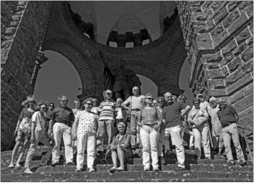
Unsere Reisegruppe auf der Treppe vor der Statue des „Willem“