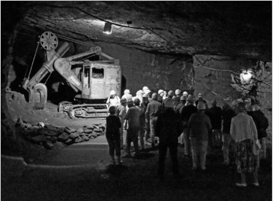
Maschinenbesichtigung im Stollen unter fachkundiger Erklärung