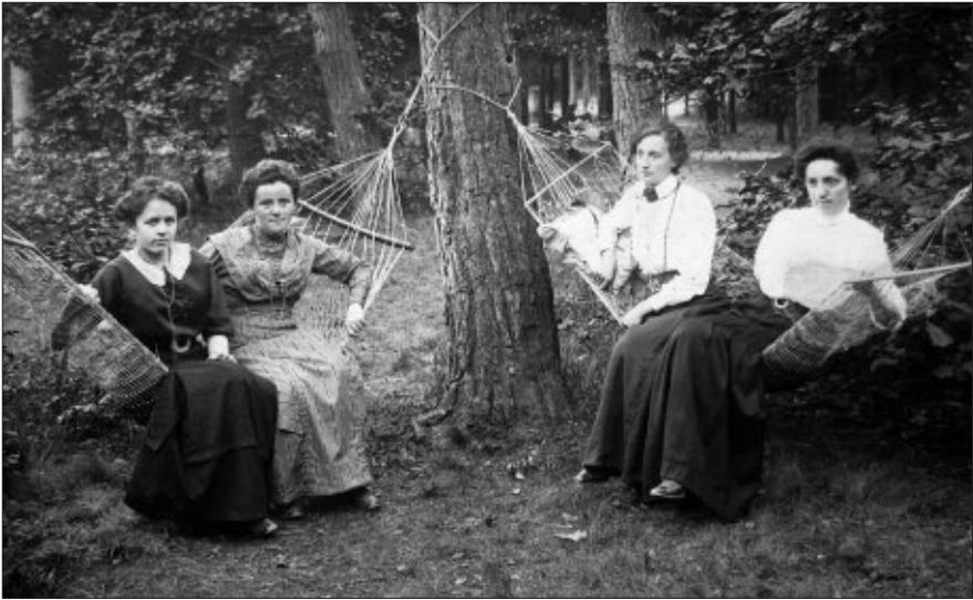
Die typische und bewährte Kuranwendung in Lippspringe vor über 100 Jahren; der Kurwald entfaltete schon damals seine therapeutische, heilsame Wirkung. In Hängematten verweilten die Damen in der gesunden, angenehmen Waldluft. Auch sie waren damals Gäste der Pension Witte, Jordanstraße 6.