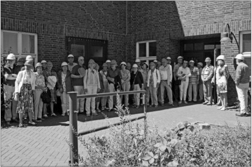
Gruppenbild mit Helm vor der Einfahrt mit der Grubenbahn