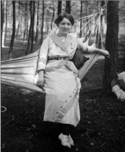
Vor rund einhundert Jahren im Kurwald (damals vielfach als „Fichtenwäldchen“ bezeichnet); die Hängematte ermöglichte einen angenehmen Aufenthalt in der würzigen Waldluft. Der Name der abgebildeten Dame ist nicht bekannt; sie wohnte damals in der Pension Witte, Jordanstraße 6.