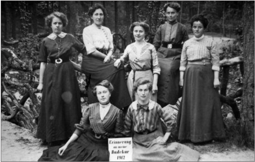
Sieben Damen während einer Badekur in Bad Lippspringe. Sie wohnten damals in der Pension Witte, Jordanstraße 6. Die Pension mit mehreren Gästezimmern wurde geführt von Maria und Johann Witte. Die Aufnahme ist Anfang August 1912 entstanden.