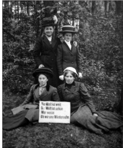
Auch diese Damen waren damals zu Gast in der Pension Witte, Jordanstraße 6. Die Aufnahme ist vermutlich vor dem Ersten Weltkrieg entstanden und zeigt die typische Mode jener Zeit.